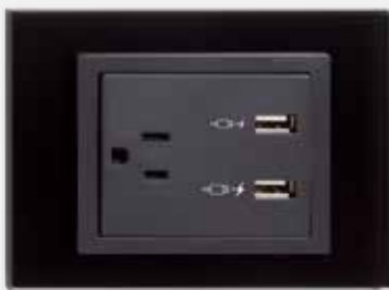
Toma corriente con dos cargadores USB