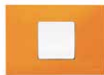
3.-Conjunto armado con posibilidad de añadir una tecla de color.