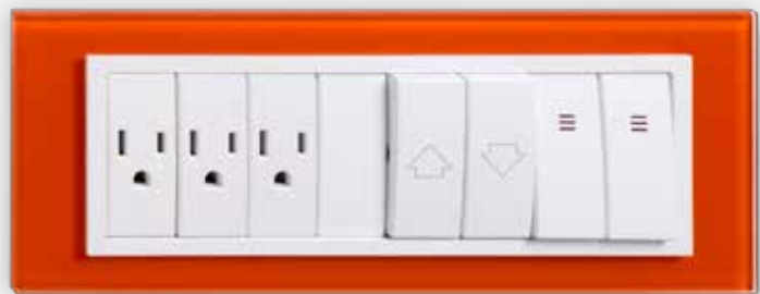
Placa de 8 Módulos