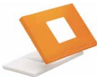
2.-Clipaje de la funda intercambiable sobre la placa.