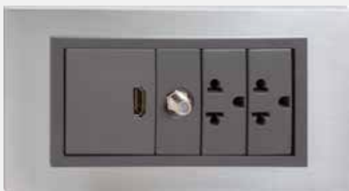
Placa de 5 Módulos