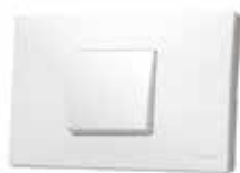
1.-Placa + mecanismos.

Cambia la imagen de tu mecanismo 27 Play de una forma fácil y sencilla. Sin herramientas y mediante un simple clic. Las fundas intercambiables, se presentan en cuatro gamas diferentes que facilitan la personalización en función del espacio y la decoración.