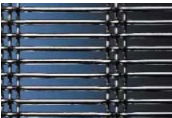
Malla Alargada Triple Enlace