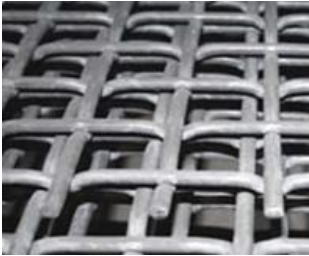
Malla Cuadrada Cara Plana