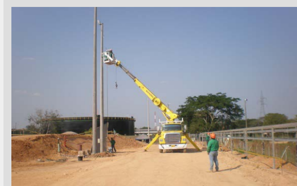
Alumbrado Vias acceso Estación Vasconia III Ecopetrol -Pto Boyacá