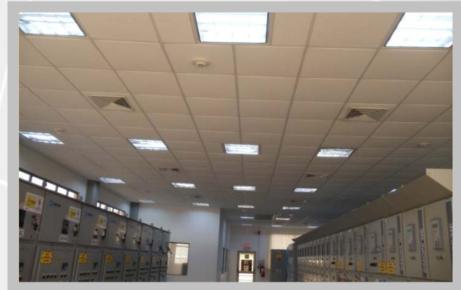
Sistema de Detección Estación PIA 5 y PIA 6 Ecopetrol Centro – B/bermeja