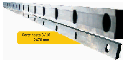
Corte hasta 3/16 2470 mm.