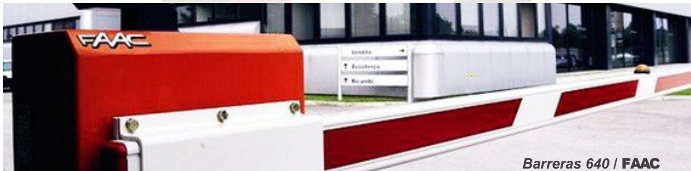
Barreras 640 / FAAC