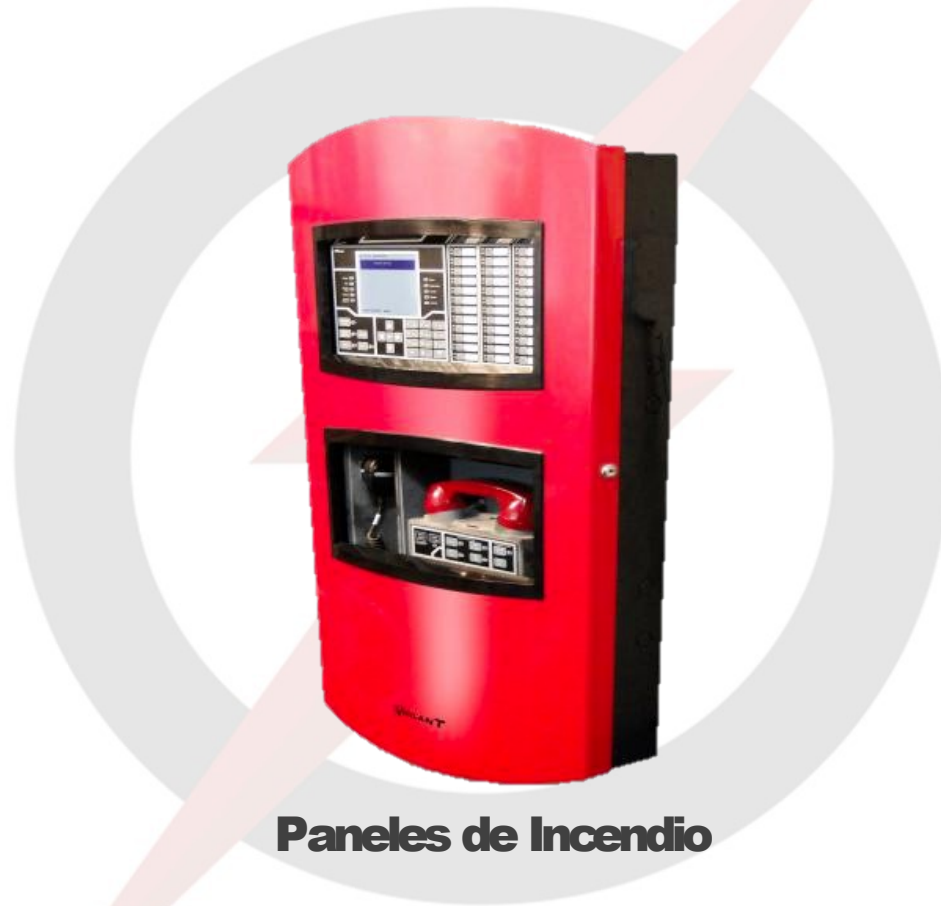
Paneles de Incendio