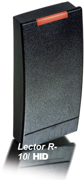
Lector R-10/ HID