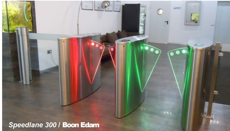
Speedlane 300 / Boon Edam