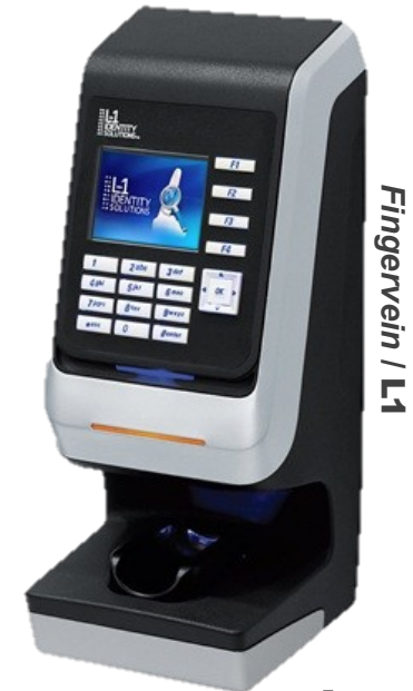
Fingervein / L1